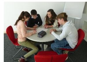
Bild 4: Ort für konstruktive Gespräche: Schüler der 8a testen den neuen Besprechungsraum.