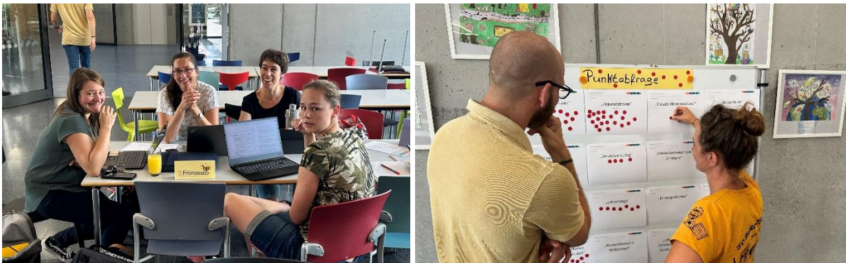
Bilder: Mit Vollgas in das neue Schuljahr – Präsenztage des Kollegiums.

Traditionell treffen wir uns in der letzten Schulwoche zu unserer mehrtägigen Klausurtagung, den sogenannten „Präsenztagen“. Hier standen Fachschafts- und Stufenkonferenzen, Dienstbesprechungen, Klassenkonferenzen und Übergabegespräche (bei Klassenlehrerwechseln) auf der Agenda. Die Stimmung im Team war gut, das Kennenlernen mit den neuen Kolleginnen und Kollegen machte viel Spaß und die motivierende Vorfreude auf das Schuljahr war überall spürbar.