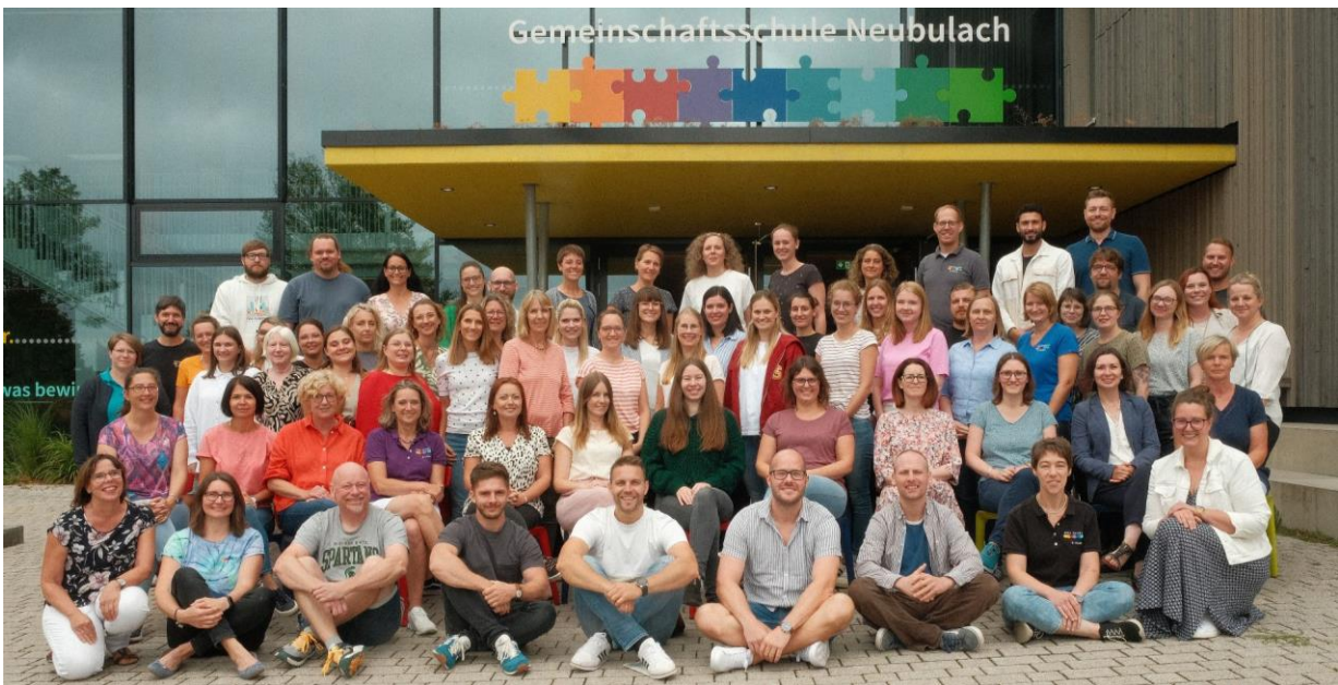
Bild: Das Team der GMS Neubulach im Schuljahr 2024/25.

Wir hoffen, das Schuljahr hat für Sie und Ihre Kinder gut begonnen und freuen uns auf das gemeinsame Schuljahr mit Ihnen allen!